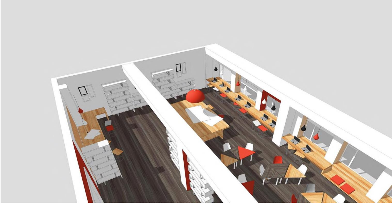
Аудитория: зона для 3D-оборудования.

Аудитория: зона для 3D-оборудования, стеллажи и шкафы, верстаки для работы с ручным инструментом.